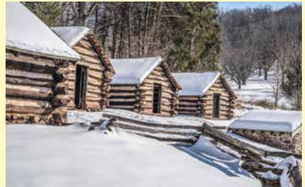
Botháin clúdaithe le sneachta in Valley Forge.

Na blianta 1778-1782: Is mó cath a troideadh i rith na réabhlóide. D'éirigh leis an dá thaobh cathanna áirithe a bhuan. D'úsáid na Meiriceánaigh treallchogaíocht. Ba é a bhí i gceist