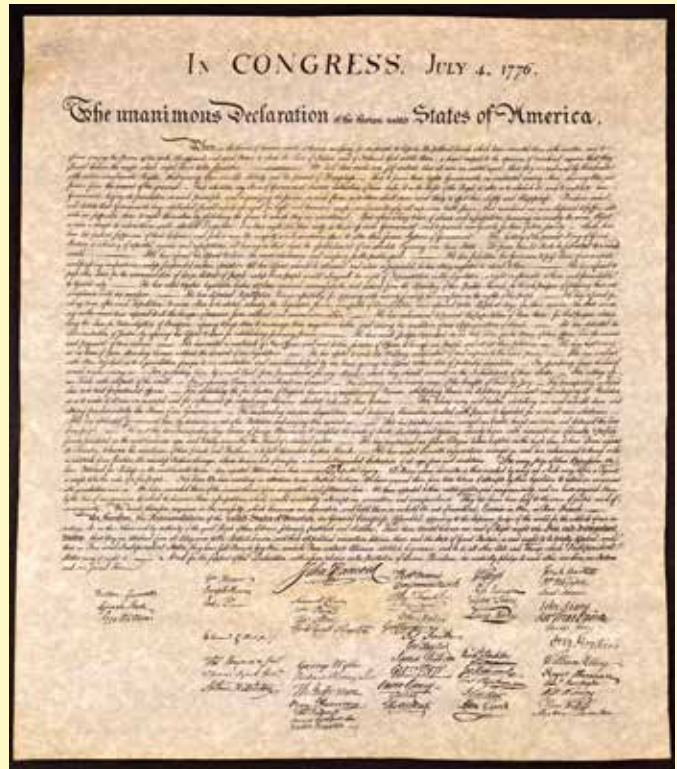
Pictiúr d'Fhorógra na Saoirse, is féidir síniú na n-ionadaithe a fheiceáil ag an mbun. Tá ceisteanna ar Fhorógra na Saoirse ag deireadh na caibidle seo.