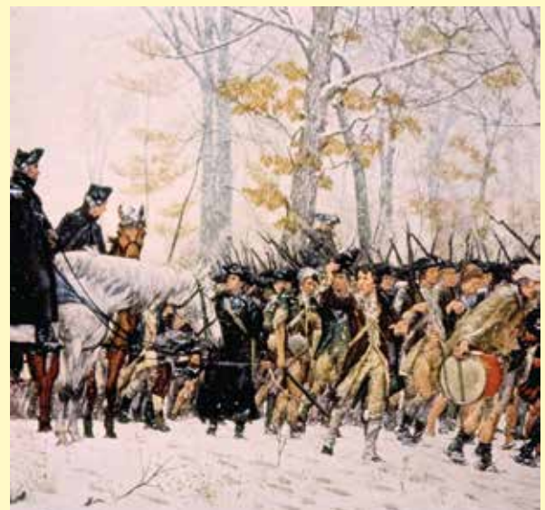
'The March to Valley Forge', péintireacht le William B. T. Trego, 1883.