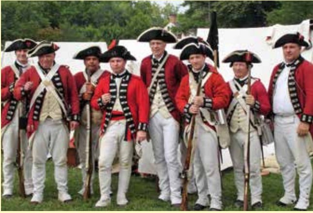
Daoine gléasta mar shaighdiúirí i Réabhlóid Mheiriceá.